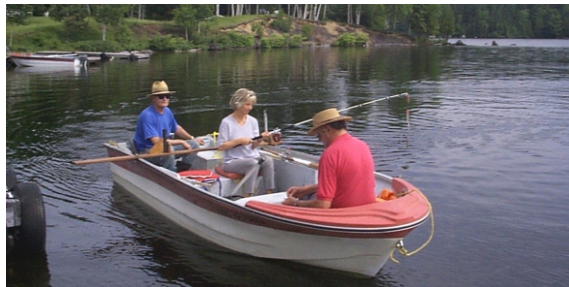
location de bateau et moteur.