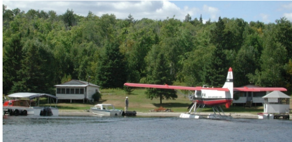
excursion en hydravion