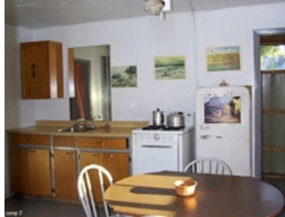
chalets spacieux et tout équipés