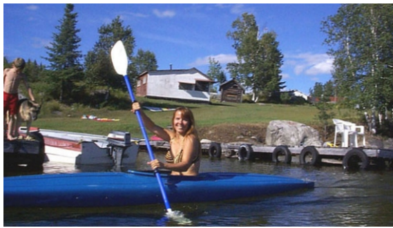
bateau, natation et plaisirs estivals